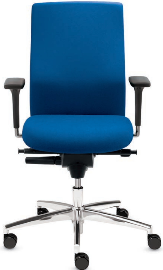
BS 2 SM 9583 sim-o S + Armlehnen/Armrests A220KGS

Drehstuhl mit hoher, höhenverstellbarer Vollpolster-Rückenlehne (57 cm) und Ballpoint-Synchron-Mechanik. Die höhen- und breitenverstellbaren 2F-Armlehnen sorgen für Entlastung im Schulter- und Nackenbereich.