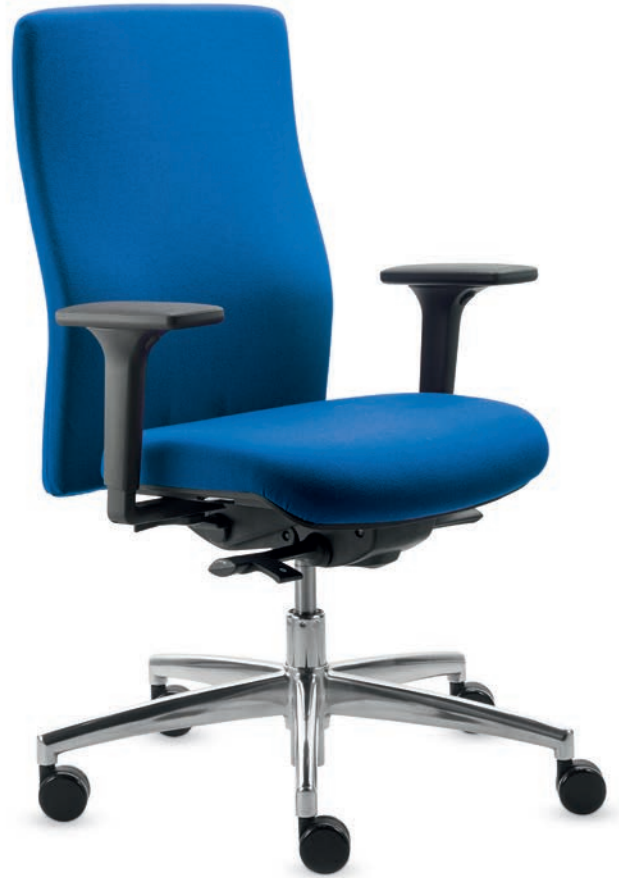
AS SM 9595 automatic + Armlehnen/Armrests A441KGS

Drehstuhl mit mittelhoher, höhenverstellbarer Vollpolster-Rückenlehne (51 cm) , wechselbarem Komfortsitz und Syncro-Automatic® Mechanik für eine automatische Körpergewichts-anpassung, optional mit Sitztiefen- (6 cm) und Sitzneigeverstellung (-1°/-6°).